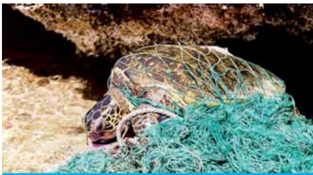
Schildkröten können weggeworfenen Fischernetzen zum Opfer fallen

Jedes Jahr landen Millionen Tonnen Abfall im Meer – der dann dort verbleibt. Überwiegend von Menschen produziert, Plastik, Holz, Metall, Glas, Gummi, Stoff und Papier bilden einen Abfall, den die Natur nicht oder nur sehr langsam zersetzen kann (siehe Abb. F). Der Müll gelangt vom Land über Flüsse, den Wind, schlecht bewirtschaftete Mülldeponien, Straßenmüll (z.B. Fast-Food-Verpackungen und Getränkedosen) und Abwassereinleitungen ins Meer. Aber Müll kann auch auf dem Meer entstehen: Schiffsabfälle und Tätigkeiten, die eine Auswirkung auf die Meeresumwelt haben, wie Seebergbau und Fischerei (z.B. zurückgeworfene Fischfängergeräte).