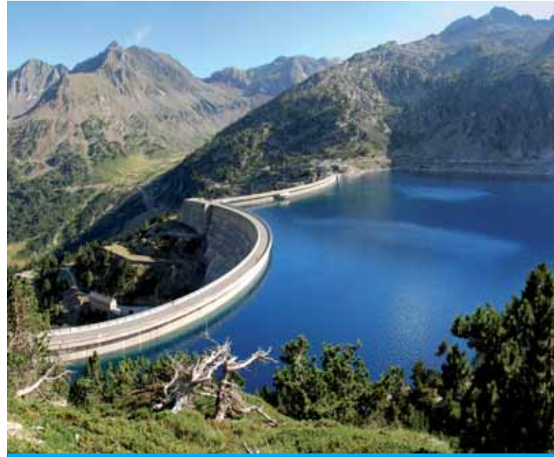
Stausee Cap-de-Long (Frankreich)

Mehr als je zuvor müssen wir auf unser Wasser aufpassen. Wir leben zwar auf einem 'blauen Planeten', der in weiten Teilen vom Wasser umgeben ist, aber das Süßwasser, das wir täglich nutzen, beträgt nur