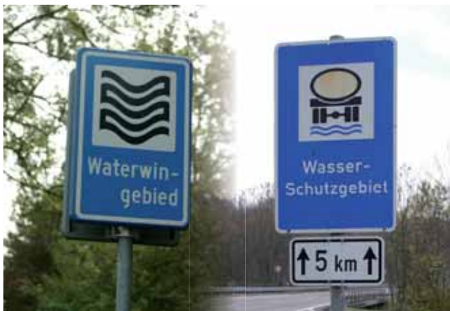
Hinweisschilder für Wasserschutzgebiete in Europa

Weil Wasser ungehindert über Grenzen fließt, haben die EU-Staaten vereinbart, ihre Gewässer mit Hilfe von Flussgebietseinheiten gemeinsam über nationale Grenzen hinweg zu verwalten. Dabei wurden insgesamt 110 Flussgebiete 7 einschließlich Nebenflüssen, Mündungen und Grundwasser ermittelt. Die Länder arbeiten zusammen, teilen sich die Verantwortung für die Flussgebiete und stimmen einen gemeinsamen Bewirtschaftungsplan ab. Jeder hat anschließend die Pflicht, die Pläne auf seinem Hoheitsgebiet mit dem Ziel umzusetzen, dass alle Gewässer der EU bis 2015 in einem guten Zustand sind. In manchen Fällen kann eine Ausnahme bzw. Verlängerung der Frist genehmigt werden. Dies ist in der europäischen Wasserrahmenrichtlinie festgelegt.