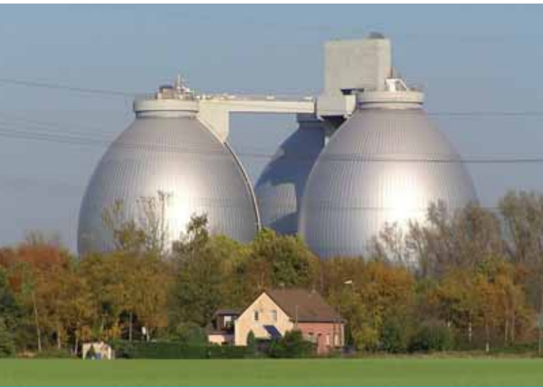
Faulbehälter, Kläranlage "Emschermündung" (Deutschland)

Neben dem behandelten und wieder eingeleiteten Abwasser fällt entsprechend behandelter Klärschlamm an, der auf sichere Weise wieder an die Umwelt zurückgegeben werden kann. In Europa wird behandeltes Abwasser vor allem in Flüsse oder ins Meer eingeleitet. Behandelter Schlamm kann (oft nach einer Verbrennung) entsorgt