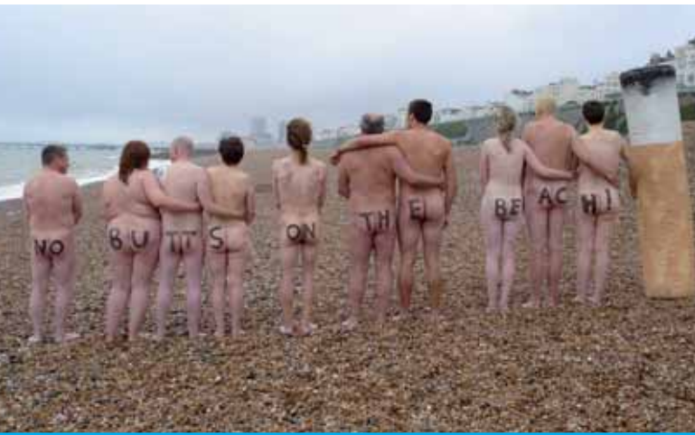
Keine Zigarettenkippen am Strand!

Baden im Meer, in Seen und Flüssen ist eine unserer Lieblingsbeschäftigungen. Jedes Jahr strömen Millionen Europäer mit ihren Familien und Freunden an die Strände, um zu relaxen und zu baden. Wie aber passen die netten Bilder von sauberen Stränden und lachenden Urlaubern in den Urlaubsbroschüren mit unserem Wissen über die Meeresverschmutzung zusammen? Industrie, Landwirtschaft, Fischerei, Tourismus, Freizeitaktivitäten (wie Schiffs- und Bootsfahrten) und die Städte verschmutzen das Meer. Dies kann eine Bedrohung für die Meeresumwelt und eine Gefahr für die Schwimmer sein. Denn das Baden in verschmutztem Wasser kann dir Bauchschmerzen, Infektionen der Atemwege und Hauterkrankungen bescheren.