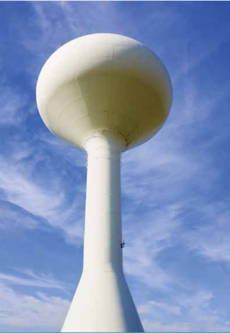
Wassertürme speichern sauberes Trinkwasser

Der Boden unter unseren Füßen mag ziemlich fest aussehen, aber ähnlich wie ein Schwamm saugt er alles auf, was wir darauf abladen: von Schwermetallen aus Altbatterien, über jegliche Art von schädlichen Substanzen in Plastik, Dünge- und Reinigungsmitteln. Sie verschmutzen das Wasser, von dem wir abhängen. Da das Wasser sich aber sehr langsam unter der Erdoberfläche bewegt, kann es Jahrzehnte dauern, bis diese Verschmutzungen in die unterirdischen Aquifer gesickert sind.