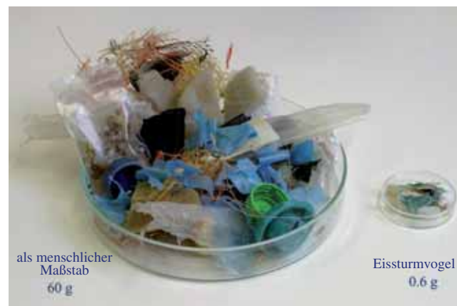
Würdest du so viel Müll wie ein Meeresvogel verschlucken, wäre die Menge ungefähr so groß wie ein Hamburger!

Hilf auch du mit, den Müll im Meer zu reduzieren und benutze deine Plastiktüte mehrfach. Werf deinen Müll nicht auf die Straße, in die Toilette oder in Gewässer. Nimm an Aufräum-Aktionen teil: http://www.signuptocleanup.org . Wir können den Umgang mit Abfall weiter verbessern und verhindern, dass der Müll unsere Meere überhaupt erreicht. Aber im Großen und Ganzen sollten wir uns mehr über die Folgen unseres Handelns im Klaren sein .